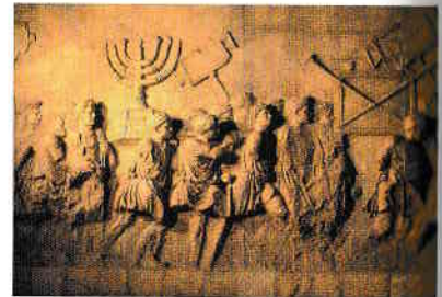
Arcul lui Titus din Roma, care imortalizează epoea căderii Templului din Ierusalim și începutul istoriei evreului rătăcitor.