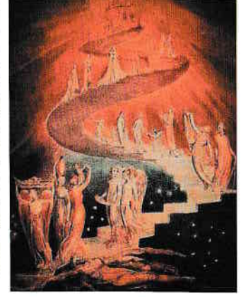
Visul lui Jacob: „Scala Cerului“